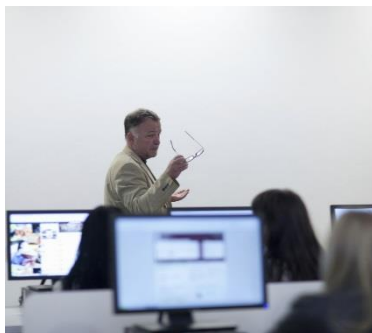
Salas de treinamento da Thomson Reuters