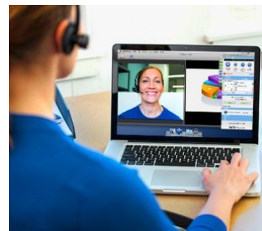
Sala de aula virtual (Webex)

Precisa de um treinamento personalizado?